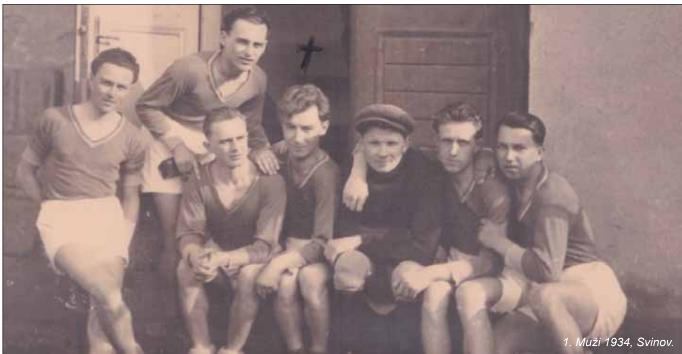
1. Muži 1934, Svinov.