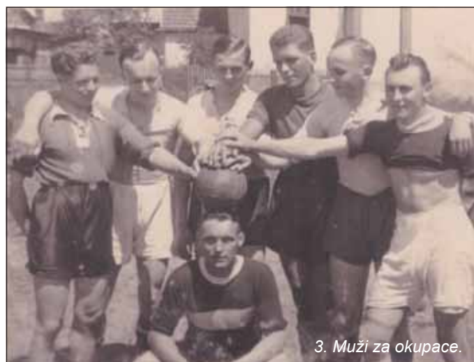
3. Muži za okupace.