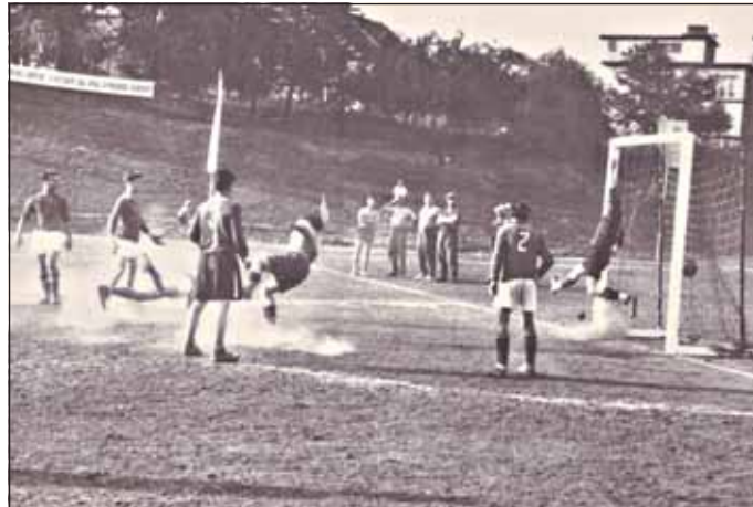
Česká házená na hřišti u sokolovny.

1945 se v již svobodném Československu a také na Moravě stala česká házená jedním z prvních sportů, který se začal provozovat. Soutěže začaly již v srpnu 1945, byly zakládány nové oddíly. Organizačně vše zajišťovalo potvrzené vedení Českého svazu házené.