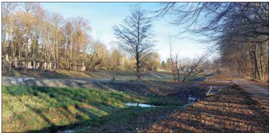
Aktuální stav rybníků v parku. Blýská se na lepší časy?

Tímto rozhodnutím došlo ke zvýšení pravděpodobnosti výrazné úspory peněz na této zakázce, protože bahno z rybníka nebylo nutno vyvážet na připravený pozemek na hranici katastru Polanky a Jistebníku, a naopak se z velké části použilo na vytvoření ostrovů. Ještě bych rád uvedl, že vysoutěžená firma souhlasila s úpravou projektu, a následně byl ke smlouvě o dílo uzavřen Dodatek č. 1. Ovšem od tohoto okamžiku začala zhotovitelská firma všemi způsoby zkoušet získat uspořené finance na jiných místech zakázky.