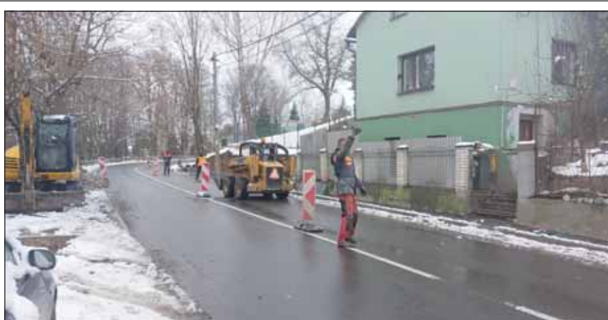
Na stavbě chodníku na ul. 28. října se pracuje i v sobotu a za sněhu.