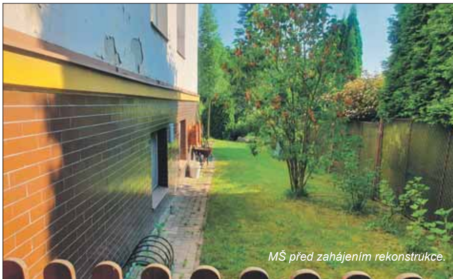
MŠ před zahájením rekonstrukce.