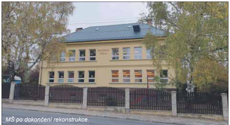
MŠ po dokončení rekonstrukce.