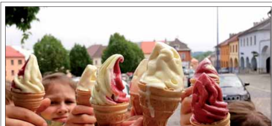
Vzpomínka na léto v Klimkovicích.