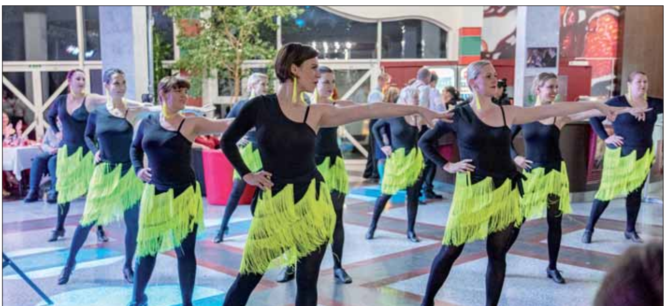
Ženy v tanci na reprezentačním plese města Klimkovic.