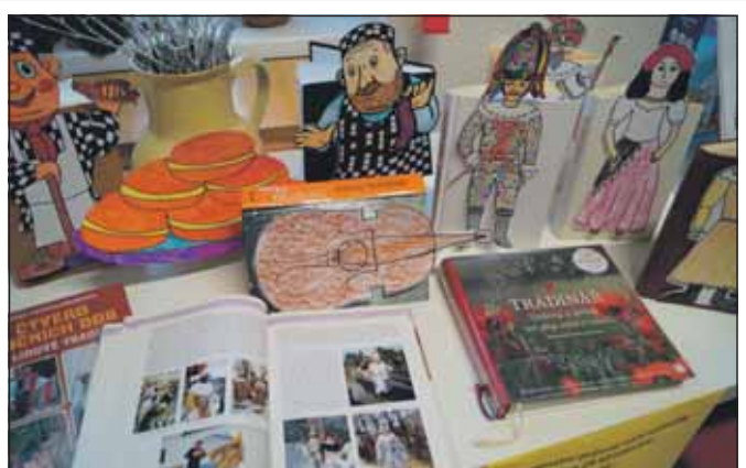
Masopustní maškary na výstavku do knihovny vytvořily děti z družiny ZŠ Klimkovice. Moc se jim povedly.