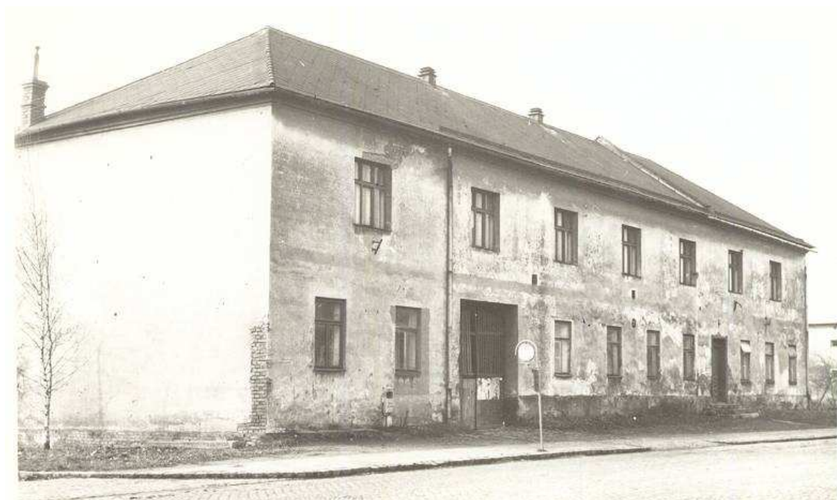
Budova kulturního domu před rekonstrukcí v r. 1966